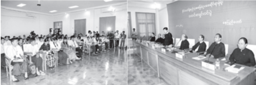
ရှင်းလင်းပြောကြား နိုင်ငံတော်ဖွဲ့စည်းပုံ အခြေခံဥပဒေဆိုင်ရာ ခုံရုံးဥက္ကဋ္ဌ ဦးသိန်းစိုး၊ နိုင်ငံတော်ဖွဲ့စည်းပုံ အခြေခံဥပဒေဆိုင်ရာခုံရုံး၏ သတင်းစာရှင်းလင်းပွဲတွင် ရှင်းလင်းပြောကြားစဉ်။ (သတင်းစဉ်)