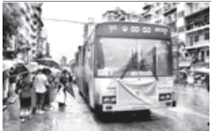
နှစ် (၅၀) ပြည့် မ.ထ.သ ရွှေရတု

၂၀၁၂ ခုနှစ်၊ ဧပြီလ (၂၆) ရက်နေ့ ပထမအကြိမ် ပြည်သူ့လွှတ်တော် တတိယပုံမှန်အစည်း အဝေး ကျင်းပခဲ့သည့်အချိန်တွင် ပြည်သူ့လွှတ်တော်ကိုယ်စားလှယ် ၁၉၀ ဦးက လက်မှတ်ရေးထိုး၍ နိုင်ငံတော်ဖွဲ့စည်းပုံအခြေခံဥပဒေအခန်း(၁၂) တွင် တရားဝင်ပေးအပ်ထားသည့် အခွင့်အရေးကို အသုံးပြုမည်ဆိုပါက သင့်လျော်ကောင်းမွန် သီးခြားလွတ်လပ်သော အဖွဲ့အစည်းများဖြစ်ပါသဖြင့် မိမိတို့ဆန္ဒအရ ကြိုက်နှစ်သက်သည့် နိုင်ငံရေးလမ်းကြောင်းကို ရွေးချယ်နိုင်ခွင့်ရှိ